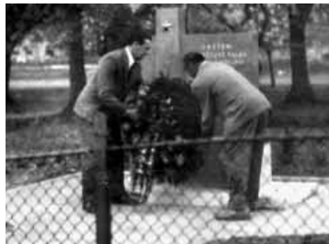
Fotografie z roku 1973