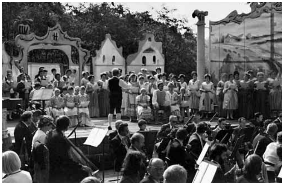
Z představení opery Antonína Dvořáka Jakobín z roku 1982

Nezřídka se stává, že jedním z přání zahraničních hostů zajímavících se o hudbu, kteří navštíví Prahu, je zavítat také do Janáčkovy rodného místa – na Hukvaldy. Na místo, kde se ve vzácné syntéze pojí krása podbeskydské krajiny