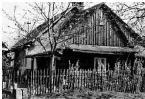
Tak vypadala chaloupka č. 9

s č. 61 (pan Písařovic), v roce 1954 č. 25 (ing. Fajkus), na ten však bylo č. přeneseno ze zbořeně stavby, která původně stála o kus dál, u čísla 24, dnes v těchto místech stojí novostavba rodinného domku, kterému bude přiděleno číslo 72. V roce 1958 je v kronice uváděno postavení domků č. 58 (Janošek), 59 (Fajkus, dříve Volný) a 60 (Velička).