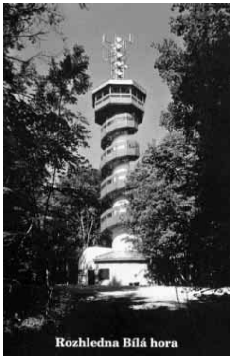
Rozhledna Bílá hora

Stojíte-li pod rozhlednou u její paty, jímá vás pocit vlastní malosti a titěrnosti.